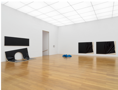
Steven Parrino. Nihilism Is Love Ausstellungsansicht / Exhibition view Kunstmuseum Liechtenstein