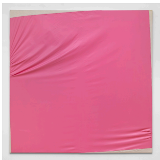
Steven Parrino Candy Stevens (Pink Disaster), 1988 Öl auf Leinwand / Oil on canvas 280 x 280 x 6 cm Kunstmuseum Liechtenstein, Vaduz Erworben mit Unterstützung der Stiftung Freunde des Kunstmuseum Liechtenstein / Purchased with support from Stiftung Freunde des Kunstmuseum Liechtenstein