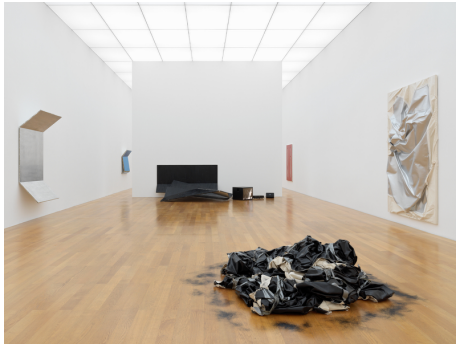
Steven Parrino. Nihilism Is Love Ausstellungsansicht / Exhibition view Kunstmuseum Liechtenstein